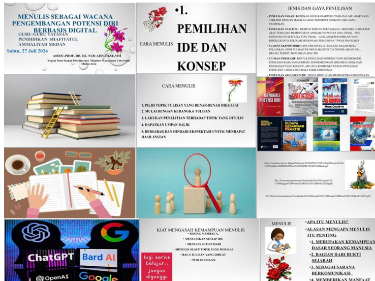
Gambar 4 Bagian Materi Kegiatan PKM