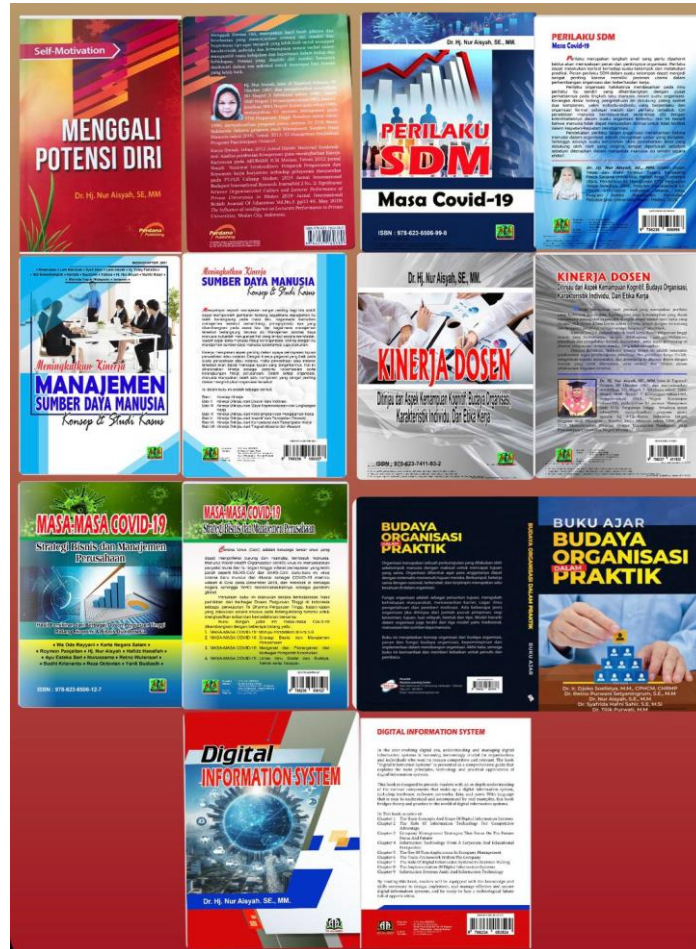
Gambar 6 Hasil Luaran Kegiatan

perkembangan IT untuk meningkatkan pengetahuan manajemen sumber daya manusia pada SMA Shafiyatul Ammaliyah, Jl. Setia Budi Medan Sumatera Utara.