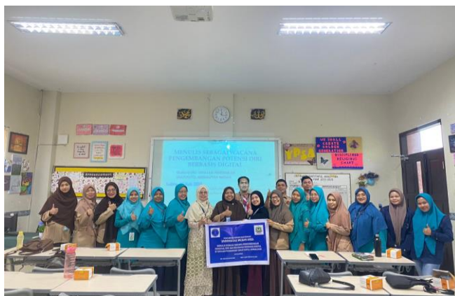
Gambar 2 Tim Pelaksana dan Peserta Kegiatan Pengabdian Kepada Masyarakat

pemahaman terhadap digitalisasi yang semakin berkembang. Pelatihan dan sosialisasi diperlukan sebagai wujud untuk meningkatkan pemahaman terhadap perubahan tersebut. Pelatihan dan sosialisasi tentang adanya perubahan kondisi tersebut menambah peningkatan kinerja dari manajemen sumber daya manusia yang bersifat positif dan merupakan penggalan potensi diri dalam pemanfaatan potensi diri sehingga secara langsung bertindak atas diri sendiri dalam memotivasi kegiatan yang bersifat positive, dan kesempatan ini tim memberikan motivasi potensi diri untuk mengadakan pelatihan digitalisasi sehingga satu demi satu bisa diwujudkan seiring dengan kebutuhan serta keinginan diri sendiri, termasuk memberikan ruang terhadap menjadikan diri sendiri sebagai seorang yang dapat mengubah mind set ketidak tahuan menjadi lebih banyak ingin tahu. Berdasarkan fenomena yang didapatkan dari mitra ini, maka tim dari pengabdian masyarakat bertujuan memberikan pelatihan sosialisasi dan motivasi tentang potensi diri mewujudkan peran guru-guru dalam menggali potensi diri sebagai manajemen SDM yang dapat memberikan pengetahuan kepada guru-guru agar dapat aktif memberikan sumbangsih mata pelajarannya yang dituangkan dalam sebuah buku yang berbasis digital pada Shafiyatul Ammaliyah.