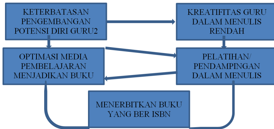
Gambar 3 Gambaran IPTEK