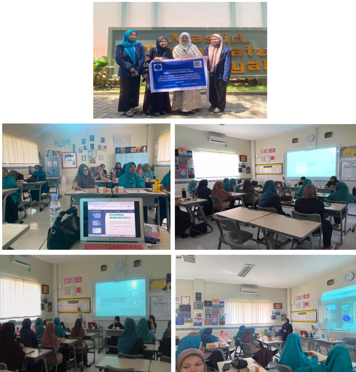
Gambar 5 Pelaksanaan Kegiatan Pengabdian Kepada Masyarakat