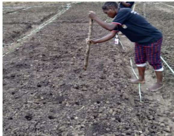
Gambar 2. Penanaman bibit sayuran oleh mahasiswa

Tahap yang berikutnya adalah penanaman bibit sayuran yang sudah disepakati oleh anggota kelompok yaitu sayur bayam dan kakung. Pada tahap ini semua kegiatan dilakukan bersama-sama dimana pembuatan lubang sampai penaburan bibit pada lubang. Kegiatan ini dapat dilihat pada gambar 2