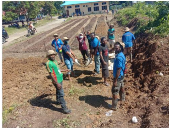
Gambar 1. Proses Persiapan Lahan Tanam

Tahap yang berikutnya adalah penanaman bibit sayuran yang sudah disepakati oleh anggota kelompok yaitu sayur bayam dan kakung. Pada tahap ini semua kegiatan dilakukan bersama-sama dimana pembuatan lubang sampai penaburan bibit pada lubang. Kegiatan ini dapat dilihat pada gambar 2