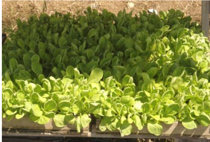
Gambar 4. Proses panen sayur

Selanjutnya pada kegiatan pelaksanaan yang ke 4 adalah panen hasil bertanam yang dilakukan bersama dosen, mahasiswa dan masyarakat. Hasil panen ini sebagian dibagikan pada beberapa masyarakat yang membutuhkan, juga di subangkan ke panti asuhan.