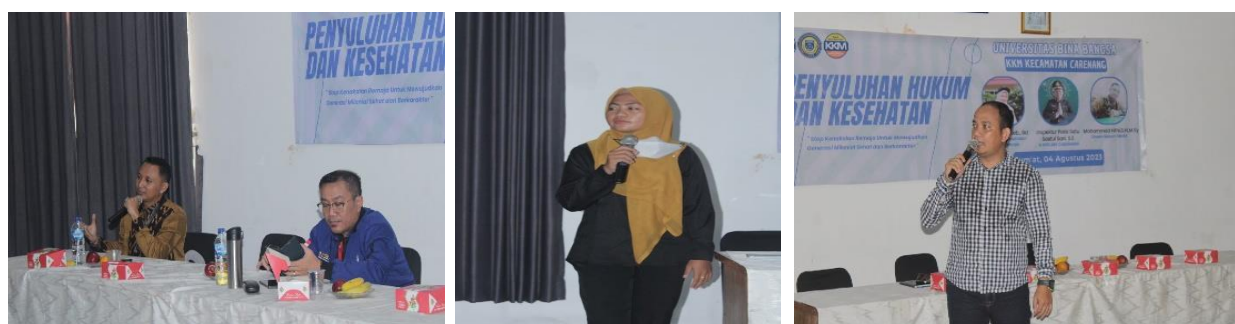
Gambar 3. Narasumber Penyuluhan Hukum dan Kesehatan

Dari hasil evaluasi melalui kuesioner yang diberikan kepada peserta penyuluhan terkait materi yang telah disajikan, terungkap bahwa: