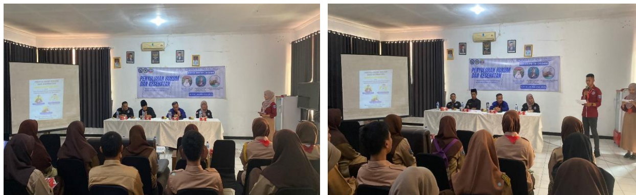
Gambar 2. Kegiatan Penyuluhan Hukum dan Kesehatan