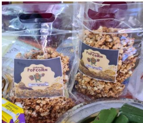
Gambar 8. Hasil Pelatihan