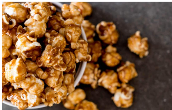
Gambar 4. Popcorn Caramel