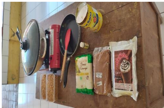
Gambar 2. Bahan dan Peralatan

Dalam gambar 2 bahan dan peralatan yang dipakai adalah Alat penggorengan dan bahan-bahan yang lainnya. Resep popcorn yang pertama adalah popcorn asin. Cara membuatnya adalah sebagai berikut: