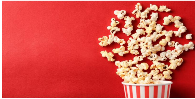
Gambar 3. Popcorn Asin

Popcorn rasa caramel bisa jadi pilihan. Cara bikin popcorn caramel adalah sebagai berikut.