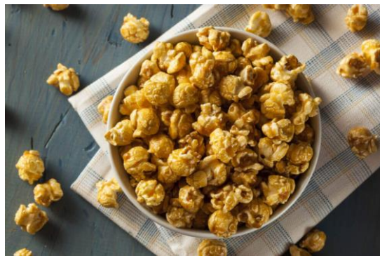
Gambar 5. Popcorn Caramel Saited