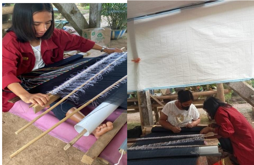
Gambar2 Proses Menenun

Pendampingan motif tenun baru tidak hanya berfokus pada aspek teknis tetapi juga aspek pemasaran Pengrajin diberikan pengetahuan tentang cara memasarkan produk tenun baik secara offline maupun online. Para pengrajin dibekali cara mengetahui target konsumen kain tenun, apa yang dibutuhkan konsumen serta cara menjangkau konsumen salah satunya dengan menggunakan media sosial. Pemanfaatan media sosial dan platform e-commerce menjadi sarana yang efektif dalam memasarkan produk. Pengrajin diajarkan membuat konten yang menarik, dan berinteraksi dengan konsumen melalui media sosial. Dengan memanfaatkan teknologi digital, diharapkan para pengrajin kain tenun di Kelurahan Rantealang dapat menjangkau pasar yang lebih luas sehingga dapat meningkatkan penjualan. Salah satu contoh media sosial yang digunakan dalam promosi kain tenun pada Kelurahan Rantealang diberikan nama Pesona Tenun.