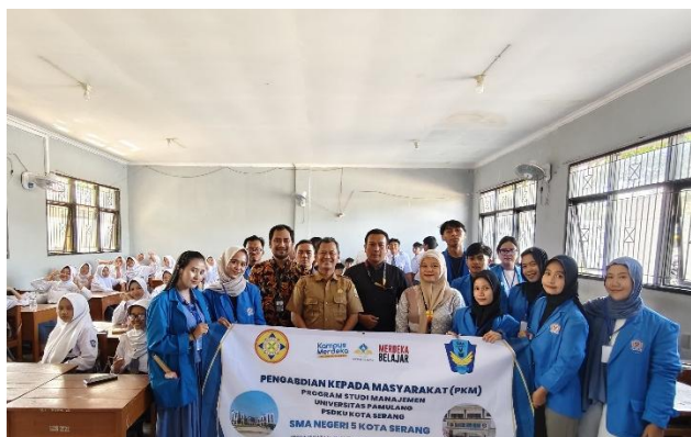
Gambar 1. Foto Bersama Kegiatan PKM