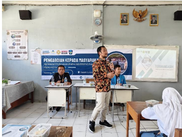
Gambar 2. Kegiatan Pemaparan Materi