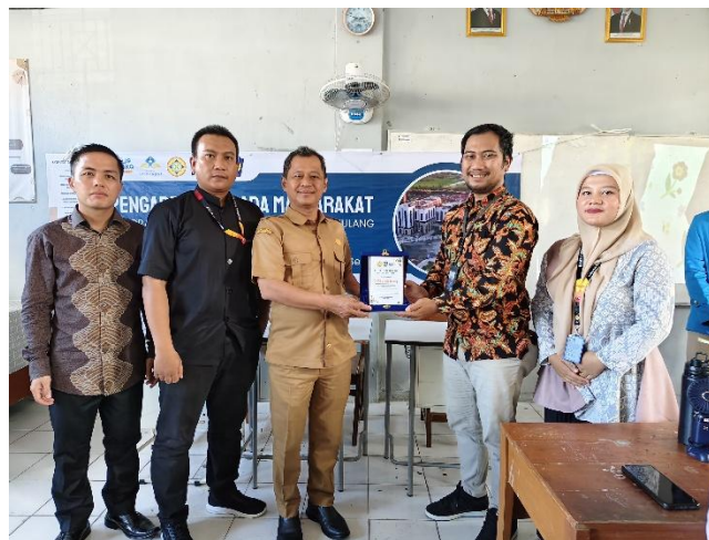
Gambar 3. Serah Terima Cenderamata

Dengan adanya program ini, siswa tidak hanya mendapatkan teori, tetapi juga pengalaman langsung dalam merencanakan bisnis mereka sendiri. Hal ini akan menjadi bekal berharga bagi mereka saat memasuki dunia kerja atau ketika ingin menjadi wirausahawan di masa depan. Kegiatan ini juga membuka peluang bagi sekolah untuk mengembangkan program serupa dengan cakupan yang lebih luas, termasuk kolaborasi dengan pelaku usaha dan akademisi dalam memberikan pelatihan lanjutan.