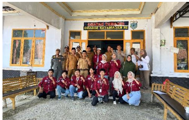
Gambar 1. Tim Pengabdian Kepada Masyarakat

Di era modern, reformasi agraria tidak hanya menuntut penyelesaian administratif, tetapi juga transformasi digital dalam sistem pertanahan. Digitalisasi layanan pertanahan merupakan langkah penting untuk meningkatkan transparansi dan mengurangi praktik maladministrasi (Putri & Aliyah, 2024). Dengan demikian, PTSL tidak hanya menjadi program legalisasi aset tetapi juga menjadi landasan transformasi tata kelola agraria.