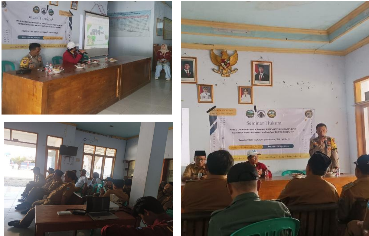
Gambar 2 Kegiatan Pelaksanaan Pengabdian kepada Masyarakat di Desa Ciamis

Dari skemema pengabdian masyarakat diatas diuraikan yaitu berupa pemberian penyuluhan dan ceramah sebagai bentuk dan upaya sosialisasi/pendampingan, kemudian diajukan dengan tanya-jawab untuk memperoleh hasil dan solusi sebaga bentuk pemecahan masalah dan kendala yang dihadapi warga yang dilengkapi dengan memperlihatkan dan pemberian contoh-contoh.