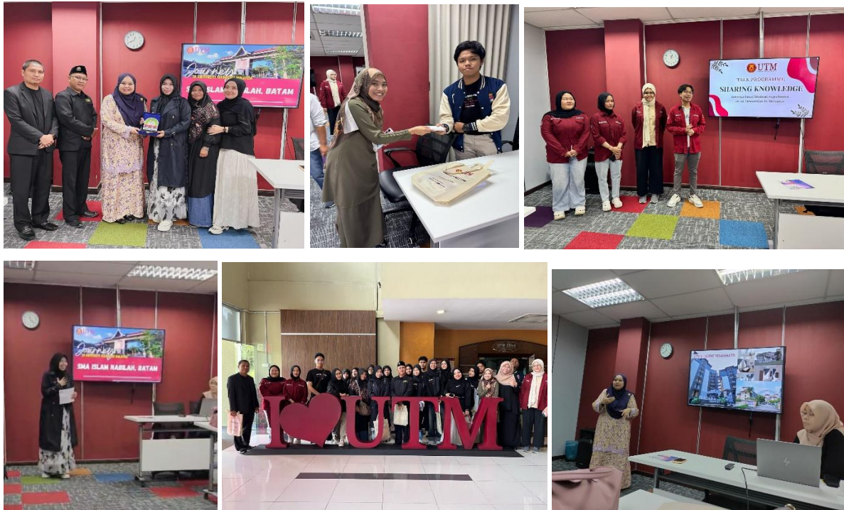
Gambar 7 Pelaksanaan Kunjungan SMA Islam Nabilah ke UTM

Lulusan SMA Islam Nabilah diterima di beberapa universitas terbaik di Indonesia dan beberapa di luar negeri . Alumni SMA Islam Nabilah diterima di : Universitas Gajah Mada, Universitas Brawijaya, ITS, Universitas TRISAKTI, Universitas Padjajaran, Universitas Negeri Padang, Universitas Diponegoro, Universitas Negeri Semarang, UIN Syarif Hidayatullah, Universitas TELKOM dan banyak lagi universitas terbaik.