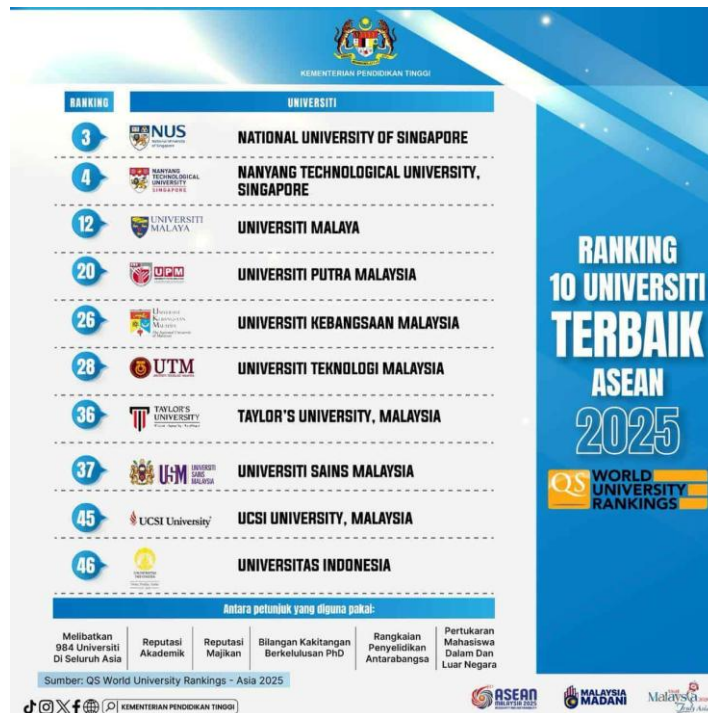
Gambar 2 Ranking 10 Universiti Terbaik ASEAN 2025

Sedangkan Program Kunjungan SMA Islam Nabilah, Batam, Kepulauan Riau, Indonesia ke Universiti Teknologi Malaysia (UTM) karena Universitas tersebut termasuk dalam Universitas Terbaik ke-6 di Asia Tenggara, dalam Senarai Universiti Terbaik Di Malaysia (QS World University Ranking) yang dimuat dalam eCentral, May 2025.