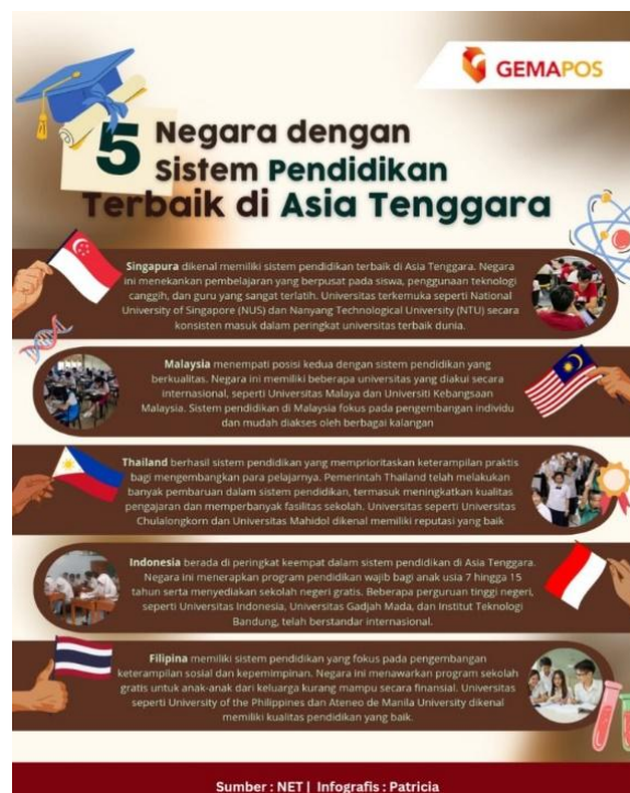
Gambar 1. 5 Negara dengan Sistem Pendidikan Terbaik di Asia Tenggara

Kualitas pendidikan adalah faktor utama yang paling krusial karena menjadi tolok ukur sekolah yang berkualitas. Sebuah sekolah yang mampu bersaing dengan sekolah-sekolah lain dinilai memiliki kualitas yang tinggi. Sebuah negara dapat dianggap maju bila sistem pendidikannya modern dan relevan. Saat warga suatu negara menyadari signifikansi pendidikan, mereka akan berlomba-lomba untuk memperoleh lebih banyak ilmu dan menghasilkan karya-karya berkualitas yang baru. Sebaliknya, negara yang memiliki mutu pendidikan rendah bisa disebut sebagai negara berkembang. Salah satu metode untuk memperbaiki mutu pendidikan adalah dengan meningkatkan mutu pengajaran. Peningkatan mutu pembelajaran atau proses belajar mengajar dapat dilakukan melalui pelatihan atau pengembangan tenaga pendidik. Elemen paling krusial dalam sebuah institusi pendidikan adalah staf pengajar. Sekolah yang baik tidak ada tanpa adanya pendidik