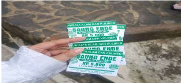
Gambar 2. Tiket Masuk Rp5.000