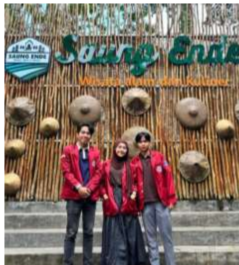
Gambar 10 Dokumentasi Tim PKM

Kendala utama meliputi keterbatasan infrastruktur akses jalan, minimnya promosi digital, keterbatasan SDM, dan fluktuasi kunjungan. Strategi yang direkomendasikan: (1) peningkatan infrastruktur melalui koordinasi pemda; (2) optimalisasi pemasaran digital via Google My Business, Instagram, dan TikTok; (3) pengembangan paket wisata terpadu; (4) inovasi kuliner berbasis resep tradisional Banten; dan (5) penguatan kemitraan dengan berbagai pemangku kepentingan.