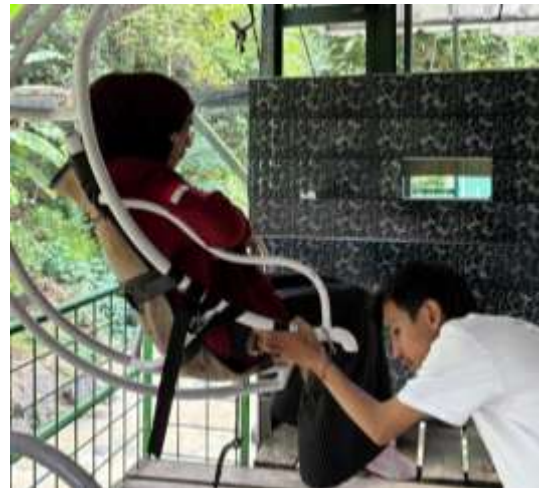
Gambar 9 Wahana Keranjang Lesung

Saung Ende juga berpotensi sebagai destinasi wisata edukatif-budaya. Aktivitas yang dapat dikembangkan meliputi demonstrasi memasak kuliner tradisional, workshop kerajinan tangan, pertunjukan seni budaya lokal, dan tur kebun mengenal bahan-bahan alami.