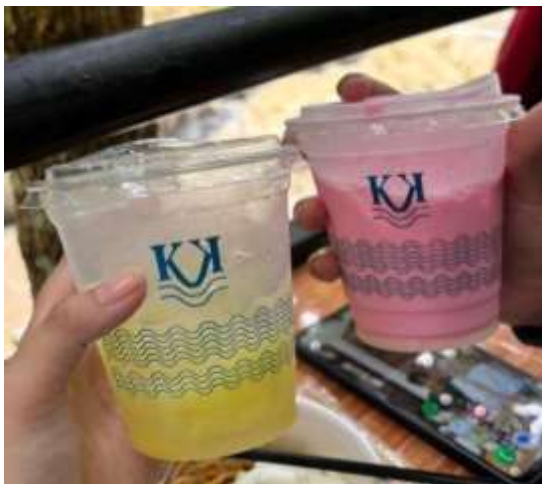
Gambar 8 Minuman Cafe

Saung Ende memiliki potensi alam yang sangat besar. Desain bangunan menggunakan bambu, kayu, dan ijuk menciptakan nuansa tradisional yang kuat. Kuliner unggulan meliputi Nasi Liwet Khas Banten, Ikan Bakar dengan bumbu khas Banten, Lalapan dan Sambal, Ayam Kampung, Minuman Tradisional (bandrek, bajigur), dan Kue Jajanan Tradisional. Keunikan kuliner terletak pada penggunaan bahan lokal segar, cara memasak tradisional, dan penyajian autentik.