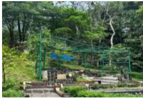
Gambar 5. Kawasan Alam Saung Ende