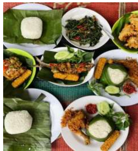
Gambar 7. Kuliner Khas Saung Ende

Ibu Bulan menyatakan mengetahui Saung Ende dari kiriman foto teman-temannya di media sosial. Ia mengapresiasi suasana yang tenang dan alami serta dekorasi yang estetik. Ia memberikan masukan agar koneksi WiFi diperbaiki dan pilihan wahana ditambah. Bapak Indra memberikan penilaian sangat positif terhadap kuliner Saung Ende, mengapresiasi cara penyajian menggunakan piring daun pisang dan wadah anyaman bambu yang menambah nilai estetika dan keunikan.