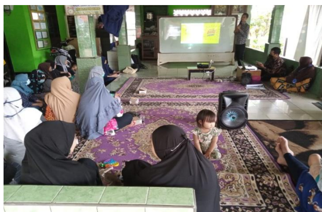
Gambar 2 Penyampaian Materi oleh Tim Pengabdian

Kota Tangerang Selatan. Kegiatan PkM dilaksanakan oleh Tim Pengabdian kepada Masyarakat (PkM) dari Program Studi Teknologi Informatika untuk membagikan pemahaman dalam penggunaan sosial media secara cerdas dan bijak, untuk menyalurkan informasi terkait dengan sosialisasi yang dilaksanakan.