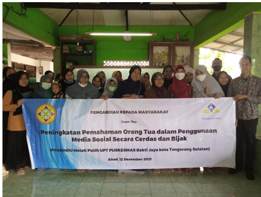
Gambar 2 Tim Pengabdian Kepada Masyarakat