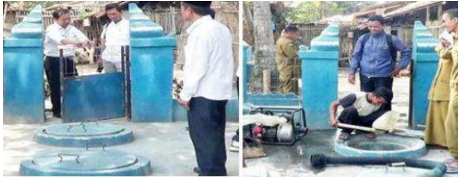
Gambar 2. Kerusakan unit pengolah Sanimas Desa Panenjoan

Kebutuhan akan air baku/ air bersih bagi semua warga Desa Panenjoan sangatlah penting hal tersebut berdasarkan hasil pemetaan zonasi air limbah domestik yang dilakukan oleh POKJA AMPL-BM Kab. Serang (2015), menunjukkan area ini beresiko tinggi dan memerlukan penanganan segera (indicator warna merah) diperkuat hasil survei dan analisis sampel air yang diambil dari Desa Panenjoan menunjukan keruh, rasa asam dan berbau. Penangan tersebut dapat diselesaikan dengan instalasi perancangan teknologi pengolahan air limbah dengan sistem filterisasi air dari pipa pvc menggunakan karbon aktif dari tempurung kelapa sebagai media utama.