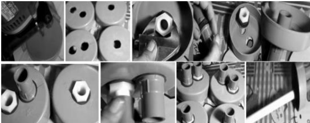
Gambar 6. Pembuatan filter air dari pipa pvc

Masyarakat diberikan pengetahuan cara membuat filter air dibuat dari pipa pvc dengan ukuran pipa spesifik diameter 4 in dengan panjang \frac{1}{2} meter sebanyak 2 buah, 4 buah Dop 4 in, 5 buah valve \frac{1}{2} in, 4 buah klem tangki vpc \frac{1}{2} in, 6 buah shock drat luar \frac{1}{2} in, 2 buah shock drat dalam \frac{1}{2} in, 7 buah L bow \frac{1}{2} in, 5 buah union \frac{1}{2} in, 3 buah sambungan T \frac{1}{2} in, 4 buah seal karet \frac{1}{2} in, paralon \frac{1}{2} in sebanyak 21 buah panjang 5 cm, pipa paralon \frac{1}{2} in panjang 18 cm 2 batang, pipa paralon \frac{1}{2} in panjang 17 cm 1 batang, pipa paralon \frac{1}{2} in panjang 45 cm 1 batang, pipa paralon \frac{1}{2} in panjang 7,5 cm 2 batang, lem pipa, kemudian semua komponen pipa vpc tersebut di instal membentuk satu kesatuan.