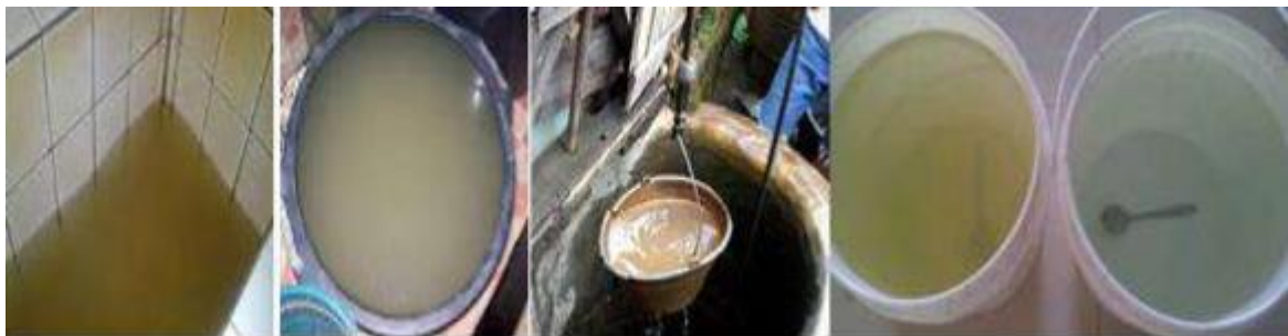
Gambar 3. Keadaan Air Desa Panenjoan 4 dari kiri dengan air baku kanan

Kebutuhan akan air baku/ air bersih bagi semua warga Desa Panenjoan sangatlah penting hal tersebut berdasarkan hasil pemetaan zonasi air limbah domestik yang dilakukan oleh POKJA AMPL-BM Kab. Serang (2015), menunjukkan area ini beresiko tinggi dan memerlukan penanganan segera (indicator warna merah) diperkuat hasil survei dan analisis sampel air yang diambil dari Desa Panenjoan menunjukan keruh, rasa asam dan berbau. Penangan tersebut dapat diselesaikan dengan instalasi perancangan teknologi pengolahan air limbah dengan sistem filterisasi air dari pipa pvc menggunakan karbon aktif dari tempurung kelapa sebagai media utama.