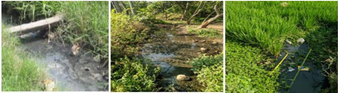
Gambar 1. Pencemaran air buangan domestic dari air limbah cucian dari kamar mandi

keperluan domestik Desa Panenjoan saat ini memiliki keadaan keruh, berasa asam dan berbau. Desa Panenjoan sebagian besar masyarakatnya mengandalkan air tanah untuk memenuhi kebutuhan akan air baku/ air bersih dalam aktivitas domestik setiap harinya, penggunaan dan pemanfaatan air untuk domestik akan menimbulkan pencemaran air apabila tidak dilakukan pengelolaan dan penanganan secara terpadu akan mengakibatkan limbah cair yang tercemar akibat dari volume pencemaran air buangan domestik baik dari air limbah cucian, kamar mandi (grey water) dan limbah dari WC (Black Water)