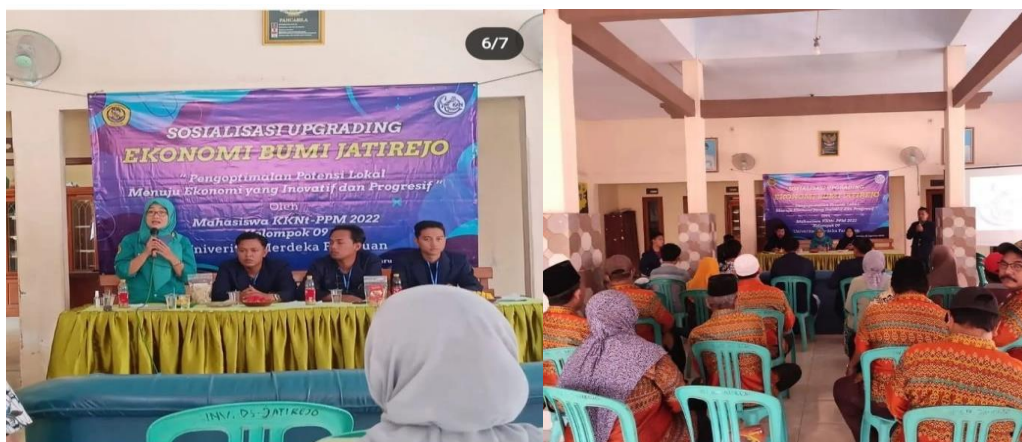
Gambar 2 Kegiatan Sosialisasi

Hasil dari kegiatan pengabdian ini adalah masyarakat memahami pentingnya wawasan terkait dunia wirausaha baik pengelolaan keuangan usaha, standarisasi produk maupun perkembangan pemasaran yang mengikuti perkembangan jaman. Dengan meningkatnya literasi terkait wirausaha maka masyarakat dusun Mimbo mampu meningkatkan kualitas produk serta siap bersaing dengan